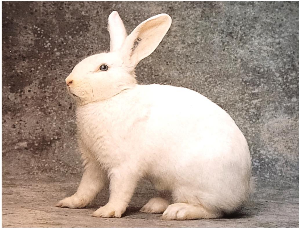
Weißer Wiener Rammler