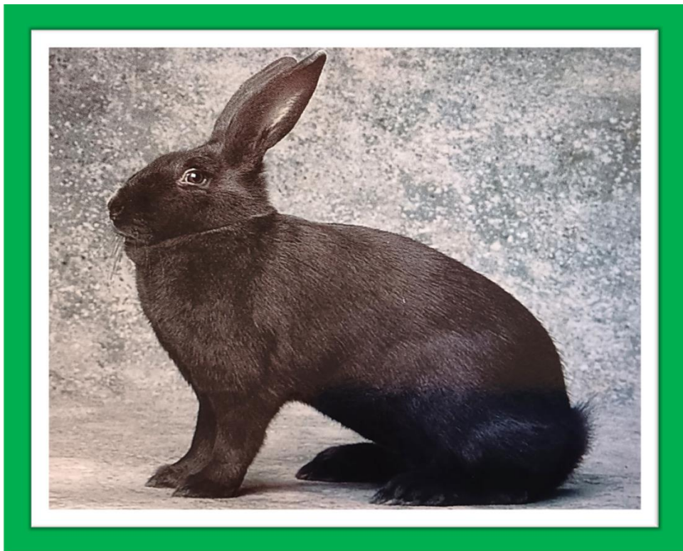
Bl Wiener Häsin